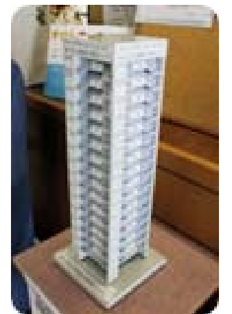
タワー（診察券置き）

7時30分～7時50分の時間帯は、受付の患者様で多少の混雑が予想されます。 混雑時を避け、8時以降の来院または“電話受付”のご利用をお勧めします。